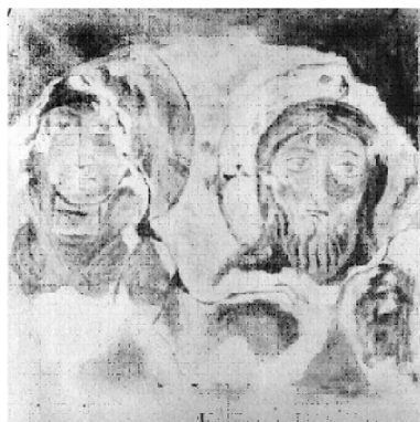
Копії фресок з Бакотського монастиря.

а в багатьох похованнях не вистачало частин скелету, які рознесли селяни. Щоб припинити це пограбування, було вирішено скласти кістяки в одну з ніш і закрити їх.