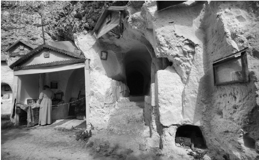
Залишки скельного монастиря (сучасне фото).

13. Колодівка – село Ушицького повіту (сучасний Кам'янець-Подільський район). Розташована неподалік Бакоти.