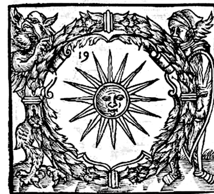
Рис. 1. Зображення герба Поділля у книзі Олександра Гваньїні (число 19 – порядковий номер рисунка).

Не можна, звісно, обминути увагою добре відомого, розтиражованого у багатьох книгах плану Кам’янець-Подільського Кипріяна Томашевича. (Незабаром після здобуття Кам’янецького Подільського військами Османської імперії кам’янецький гравер, громадянин міста, колишній вїйт К.Томашевич вигравіював вид міста і фортеці станом на початковий період турецької влади. Саме тому його зазвичай, не зовсім точно, датують 1672 роком). На жаль, у працях по історії Кам’янець-Подільського використовують не зовсім якісну літографія з плану, яка була зроблена напри-