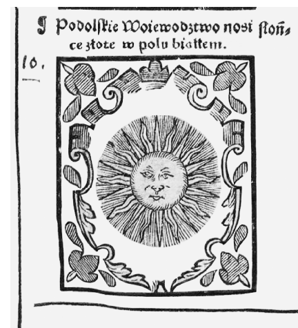
Рис. 2. Зображення герба Поділля у книзі Бартоша Папроцького “Гніздо цноти”.