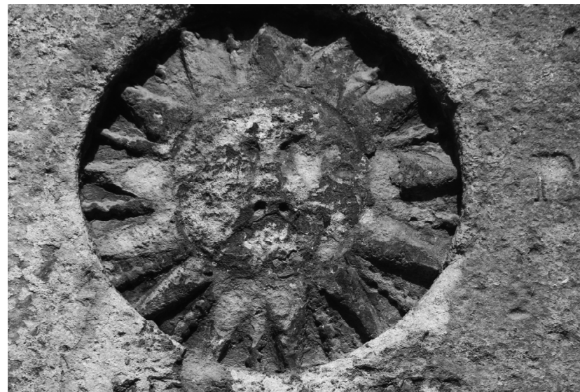
Рис. 6. Зображення герба Подільського воєводства на кам'яному пілоні на Старопоштовому узвозі.

Якщо уважно придивитися до вищеперелічених та інших зображень подільського герба часів перебування краю у складі Польського королів-