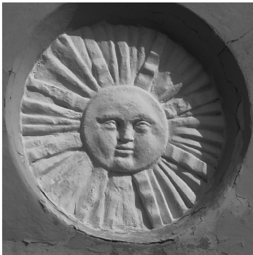
Рис. 5. Зображення герба Подільського воєводства на будівлі Ратуші.

патрона руської юрисдикції, а його зображення – на її емблемі. Герб руської юрисдикції зі зображенням св.Петра був дійсним у Кам'янці на Поділлі протягом 1491–1670 рр., тобто 180 років. Особливість герба вірменської юрисдикції полягала в тому, що зображене на ньому Боже ягня вживалося як емблема в кожній вірменській колонії України, у тих випадках, якщо вірменська громада користувалася судово-адміністративною автономією. Герб вірменської юрисдикції з емблемою у вигляді Божого ягняти існував офіційно в Кам'янці від 1496 до 1790 рр., тобто 295 років 17 .