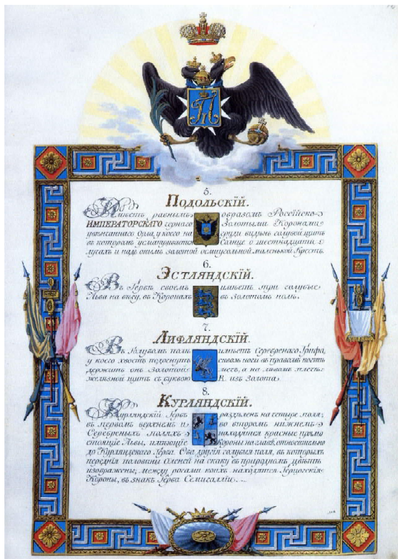
Рис. 8. Зображення герба Поділля на одній із сторінок “Маніфесту про повний герб Всеросійської імперії”.

рольдії сенатора Осипа Козодавлева: по-перше, необхідність зображення в повному гербі гербів усіх земель, що входили до титулу государя; по-друге, включення знаків ордена св. Іоанна Єрусалимського до загальної символіки Російського герба. Крім того, передбачалося створити велику державну печатку для посвідчення грамот, дипломів та інших публічних актів.