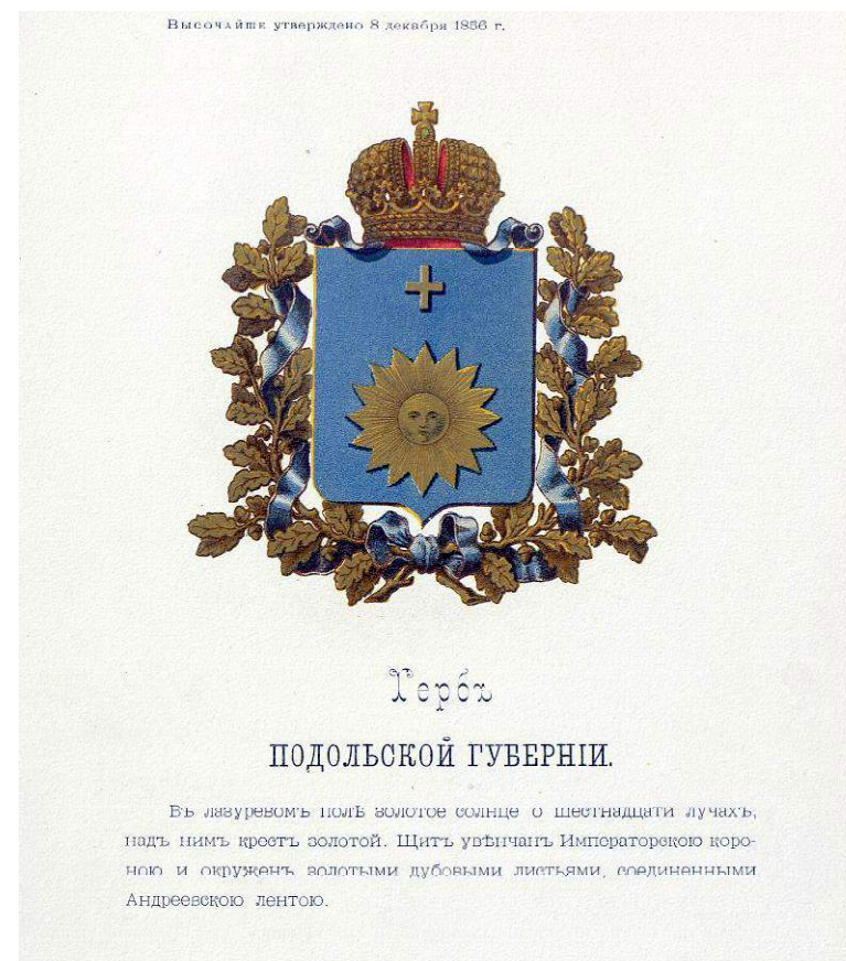
Рис. 9. Зображення нового герба Подільської губернії (1856 р.).